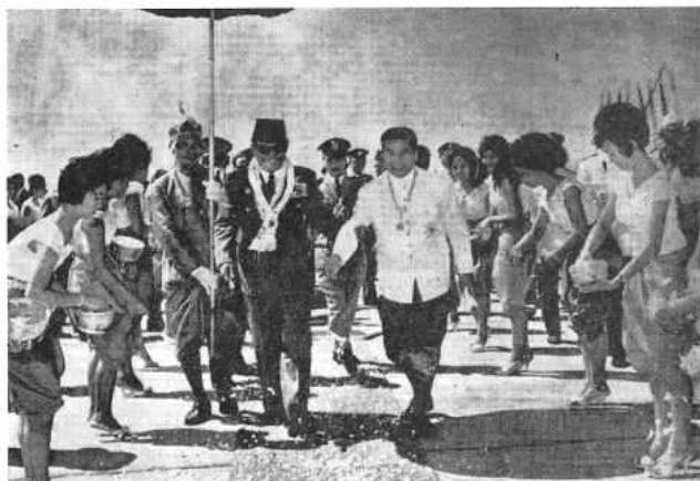
LE SPECTACULAIRE CONCENTRÉ

Dans la zone sous-développée du marché mondial , on rassemble dans l'idéologie et, à l'extrême, sur un seul homme, tout l' admirable étatique garanti, indiscutable, qu'il s'agit d'applaudir et de consommer passivement. La faible quantité des marchandises réellement disponibles tend à ramener cette consommation au pur regard. L'image du pouvoir, dans laquelle ce regard doit trouver tout son bonheur, est donc un fourre-tout des qualités socialement reconnues. Soekarno devait être à la fois un génial conducteur de peuple et un irrésistible séducteur de cinéma. Philosophe, il concentrait dans le concept de « Nasakom » le nationalisme, la religion et le « communisme » stalinien ; de même qu'il régnait à la Ben Bella, en fondant son autorité sur l'antagonisme évident de l'armée et du plus puissant parti stalinien d'Asie. Il veut continuer de tenir son « rôle unique » de représentant perpétuel de cette perfection hybride alors même que son armée a massacré, d'après lui, au moins 97.000 de ses communistes, et qu'elle continue, « Notre capacité d'arrondir les angles est telle, écrivait l'officieux Indonesian Herald après le putsch manqué du 1 er octobre, que, si Moscou et Pékin avaient adopté le système indonésien pour « résoudre » les problèmes, le conflit idéologique actuel entre les deux pays ne serait jamais devenu public. »