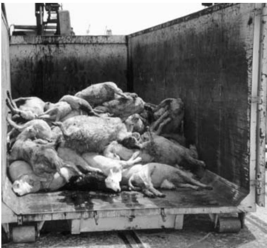
Brebis mortes avant d'arriver à leur destination, l'abattoir.