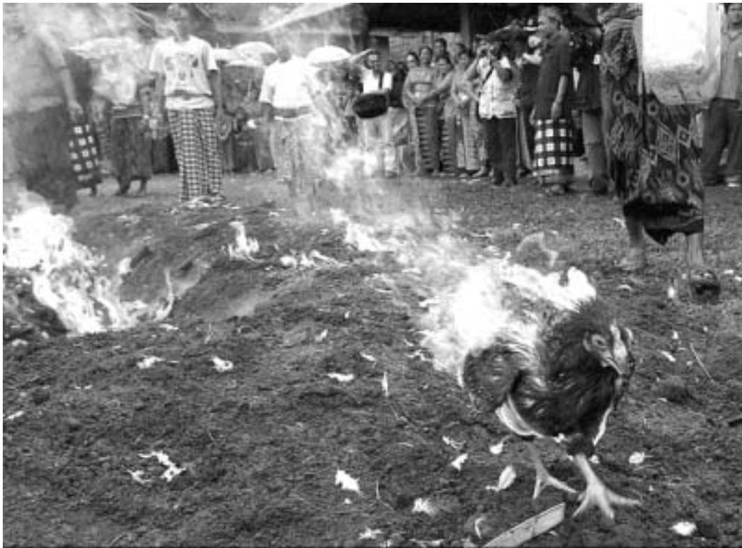
Poules et poulets brûlés vifs en Asie pour éviter une humanisation de l'épidémie de grippe aviaire.