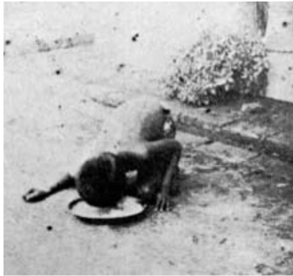
Kamala (capturée en 1920 et morte en 1929) lapant des aliments.