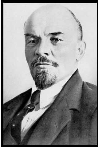
Lénine en 1918

Ce texte est extrait de: Trotsky, le Staline Manqué de Willy Huhn, (Spartacus, octobre-novembre 1981, Série B - N.113).