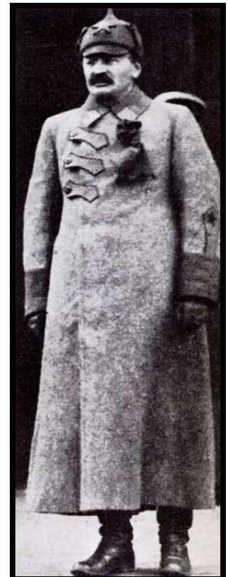
Trotsky en 1918

Pas de bureaucrates, pas de copyright. Zanzara athée (zanzara@squat.net), 2003 Première édition Zanzara athée de cette brochure: 2001.