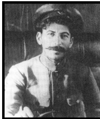
Staline en 1918

Traduit de l'anglais par Daniel Saint-James.