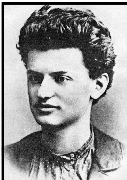
Trotsky en 1897

l'affaiblissement des conseils d'entreprise, pour ou contre une offensive politique sur la scène internationale. On échaffauda des théories pompeuses pour se concilier la bienveillance de la paysannerie, pour traiter des rapports entre bureaucratie et révolution, de la question du Parti, etc. Le summum fut atteint lors de la controverse Trotsky - Staline sur la "révolution permanente" et sur la théorie du "socialisme dans un seul pays".