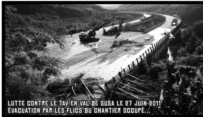
LUTTE CONTRE LE TAV EN VAL DE SUSÀ LE 27 JUIN 2011 ÉVACUATION PAR LES FLIDS DU CHANTIER OCCUPÉ...

Lors du sommet du G8 de juillet 2001 à Gênes, des grandes manifestations tournent à l'émeute et à