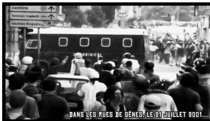
DANS LES RUES DE GÈNES. LE 21 JUILLET 2001...

l'affrontement avec les forces de l'ordre pendant trois jours. Dans la dynamique de ce qu'on appelait alors le mouvement anti-capitaliste ou anti-mondialisation, le contre-sommet de Gênes est celui où la conflictualité s'est exprimée avec le plus de violence. Le bilan est lourd : un mort, des centaines de blessés des deux côtés, des dizaines de banques et de magasins pillés et dévastés, des centaines d'arrestations et des procès qui s'éternisent jusqu'à aujourd'hui.