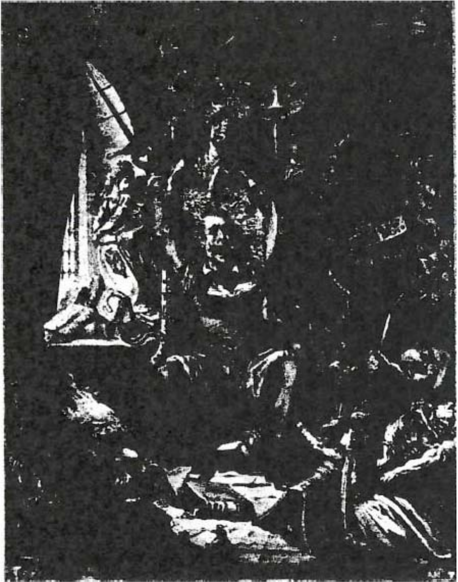
Impreso clandestinamente por la Mary Nardini gang I , compuesta por criminales queers de Milwaukee, Wisconsin.